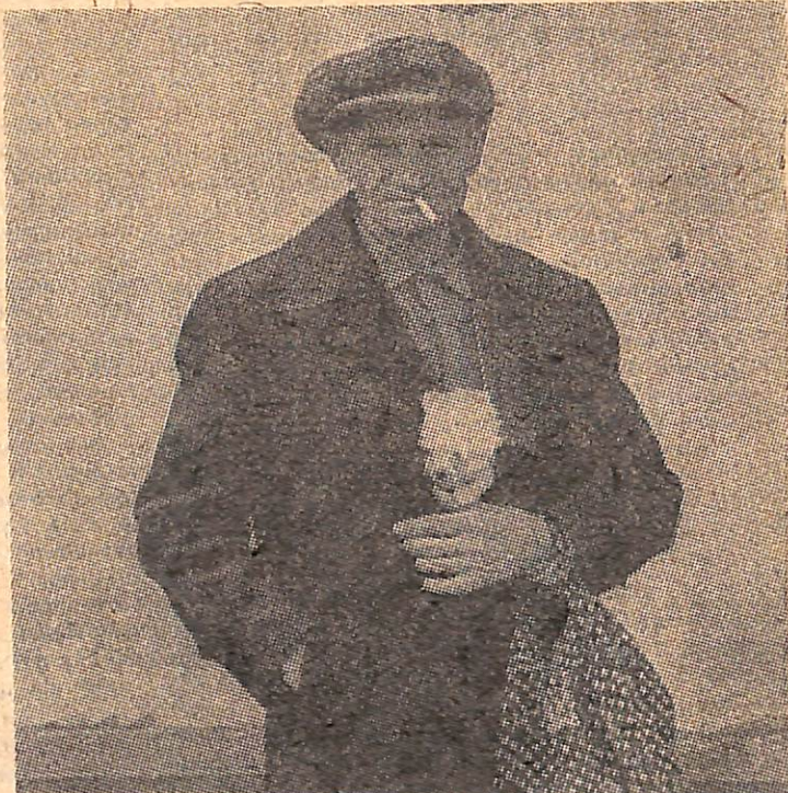
А. Новиков, «Друзья».